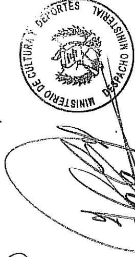
Carlos Enrique Batzín Chofoj Ministro de Cultura y Deportes